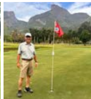
Buraco 6 04/10/2025