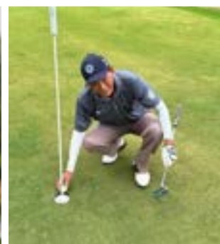
Buraco 4 30/10/2025