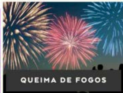
QUEIMA DE FOGOS