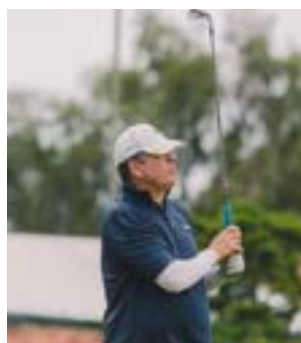
Buraco 10 25/10/2025