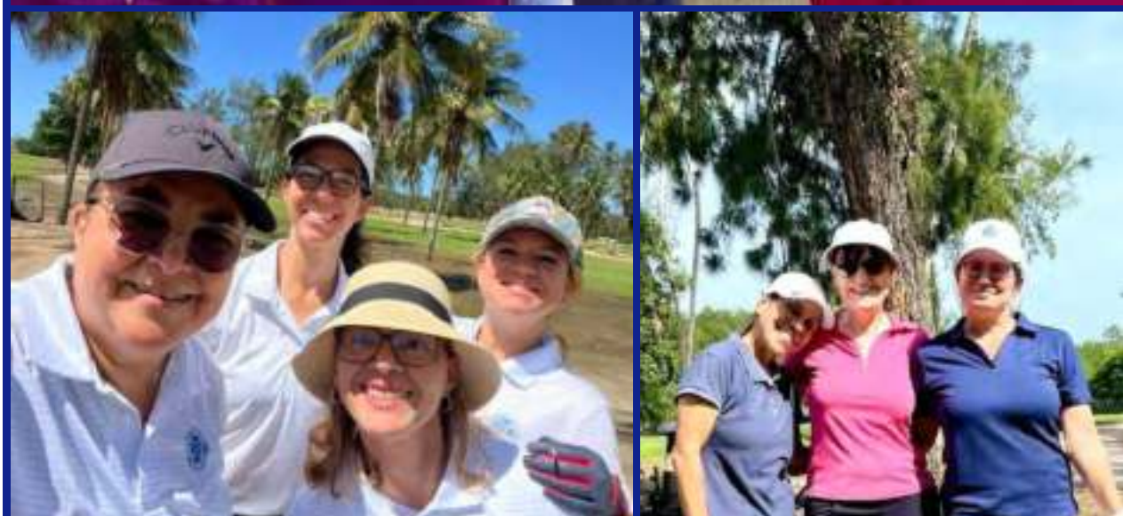
Algumas das “meninas do Bariri”: umas estão com um pé no campo principal, e outras já migraram.